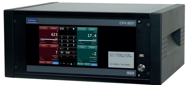
Калибратор давления для поверки системы воздушных сигналов, модель CPA8001

Модель CPA8001 выпускается как в настольном исполнении, так и для монтажа в 19-дюймовую стойку. Прибор оборудован двумя устройствами управления эталонными датчиками давления CPR8001. Датчик можно заменять через лицевую панель, не демонтируя весь калибратор (например, из поверочного стенда).