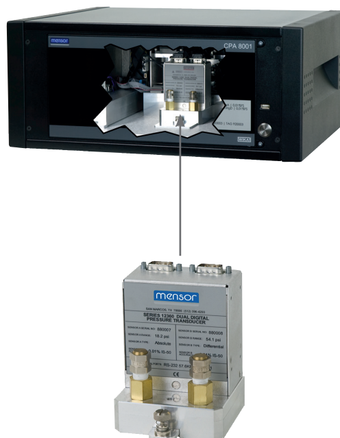
Модули аппаратной части (датчик CPA8001)

Модульная конструкция значительно облегчает проведение работ по техническому обслуживанию. Электронный модуль и калибратор являются автономными узлами, не требующими технического обслуживания. Тем не менее, в случае необходимости проведения технического обслуживания каждый элемент можно извлечь и легко заменить новым.